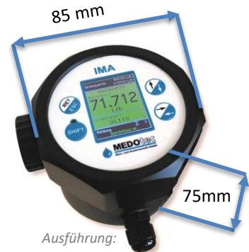
Ausführung: IMA mini PRO

Über eine Vielzahl an analogen bzw. digitalen Ein- und Ausgängen kann das IMA mini anderen Geräten Werte und Zustände weitergeben. Die Datenweitergabe bzw. Kommunikation mit dem Benutzer ist über verschiedene Schnittstellen möglich.