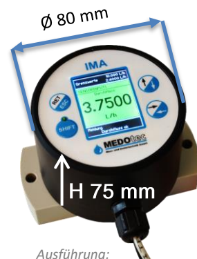
Ausführung: IMA mini COMFORT